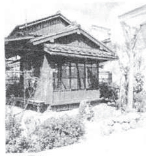
▲如己堂 この建物は、五島列島の五島市にあり、熊本の熊本氏によって建てられた。熊本の熊本氏の子孫が、この建物を管理している。熊本の熊本氏の子孫は、この建物を管理している。熊本の熊本氏の子孫は、この建物を管理している。